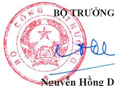
Nguyễn Hồng Diên